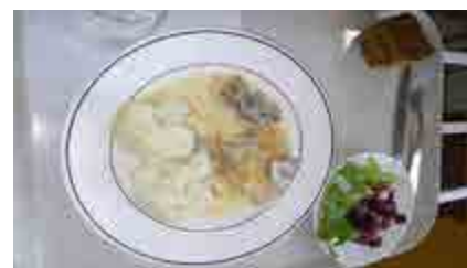
Légumes de saison, produits locaux... Du bon dans les assiettes !