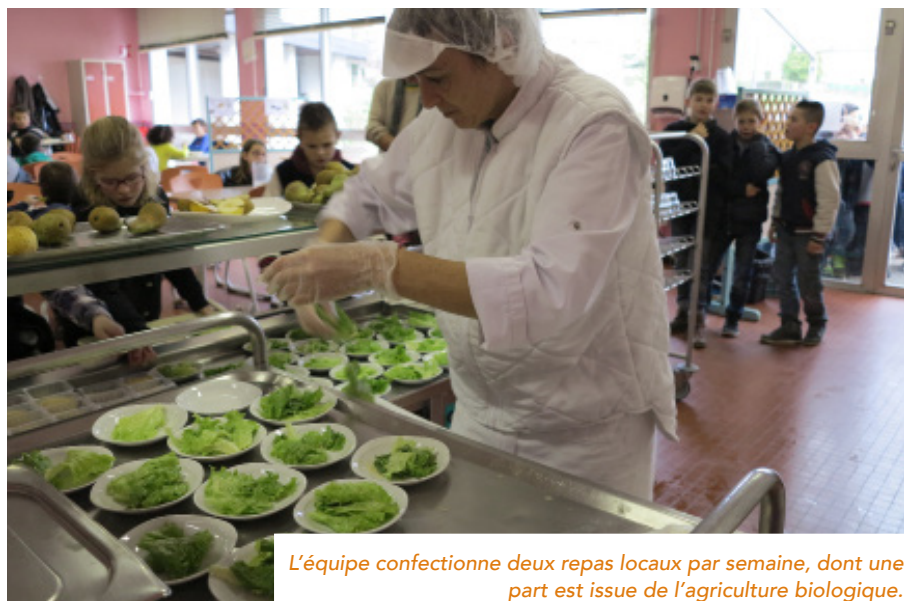
L'équipe confectionne deux repas locaux par semaine, dont une part est issue de l'agriculture biologique.

Pour le maire, les raisons du succès tiennent à 3 axes :