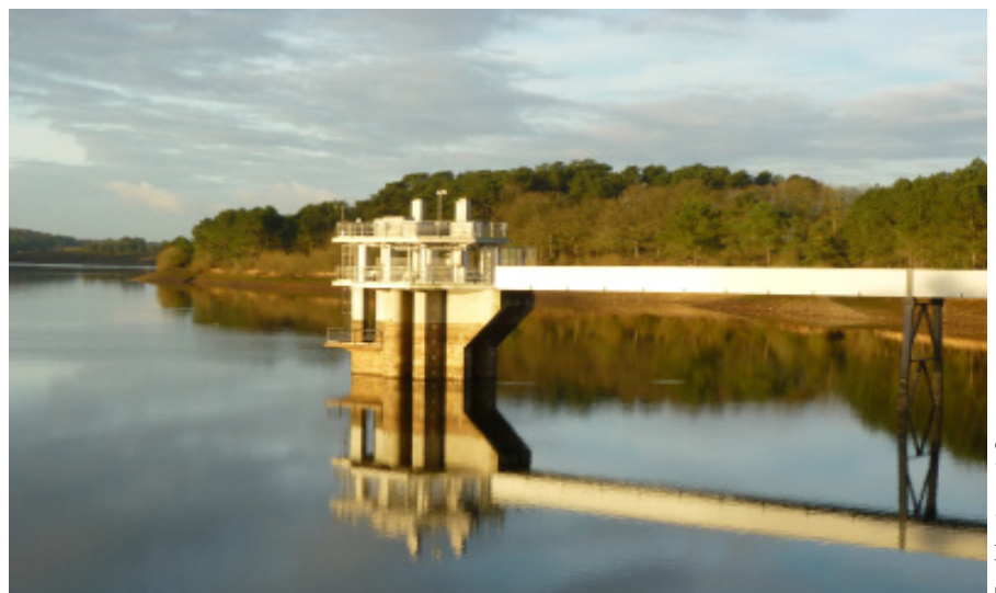
Le barrage de Chèze-Canut à Saint-Thurial, l'une des principales ressources en eau du bassin rennais, se situe dans un secteur de production laitière, porcine et avicole importante.

« Techniquement nous avons un blocage, car nos services juridiques nous alertaient sur l'impossibilité