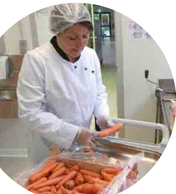
À Plessé (44), le choix du prestataire s'est basé sur un cahier des charges précis et ambitieux en matière d'approvisionnement local et bio.