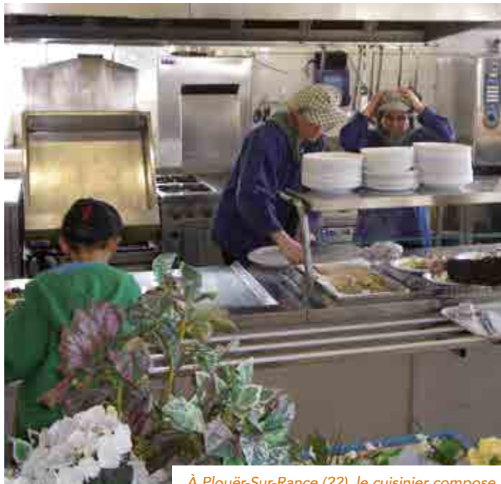
À Plouër-Sur-Rance (22), le cuisinier compose les menus en lien avec une diététicienne et des représentants de parents d'élèves.