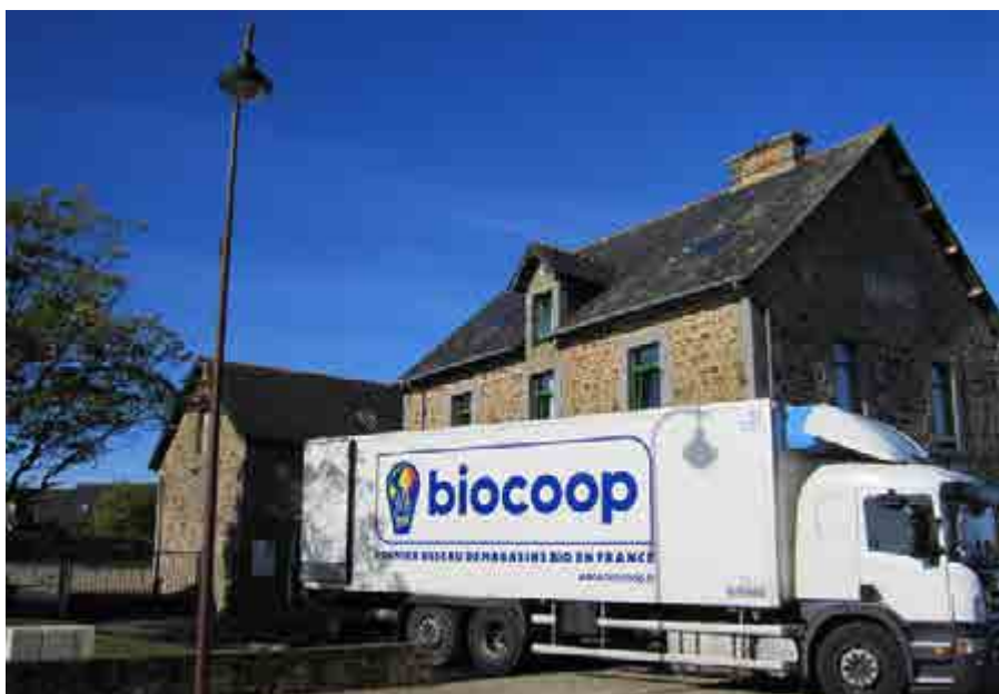
La plateforme Biocoop restauration, située à Melesse, livre la cantine de Langouët au même titre que les magasins Biocoop du territoire

10 ans après, la cantine de Langouët ne désemplit pas. 70 à 80 enfants y mangent tous les jours. Des familles viennent habiter à Langouët pour son engagement écologique et social. Une quatrième classe a ouvert dans l'école. ■