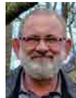
Saint-Jean La Poterie ©

« Nous souhaitons impulser une dynamique au niveau des 31 communes de l'agglomération pour introduire plus de bio local dans les restaurants scolaires »