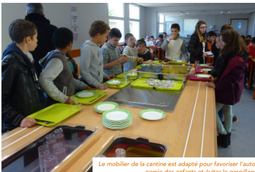
Le mobilier de la cantine est adapté pour favoriser l'autonomie des enfants et éviter le gaspillage