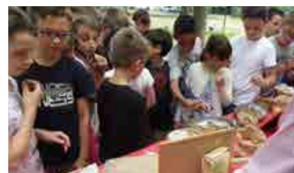
Découverte des différents types de pain

Le prestataire définit les menus tous les 2 mois, puis les transmet au cuisinier qui peut demander des modifications en fonction des produits disponibles et des saisons.