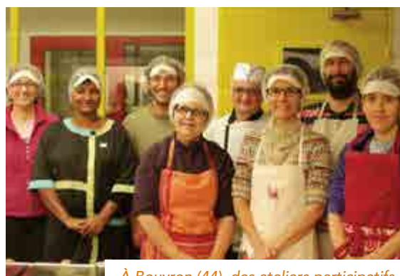
À Bouvron (44), des ateliers participatifs ont permis d'échanger sur la cuisine, la pédagogie et la réglementation.