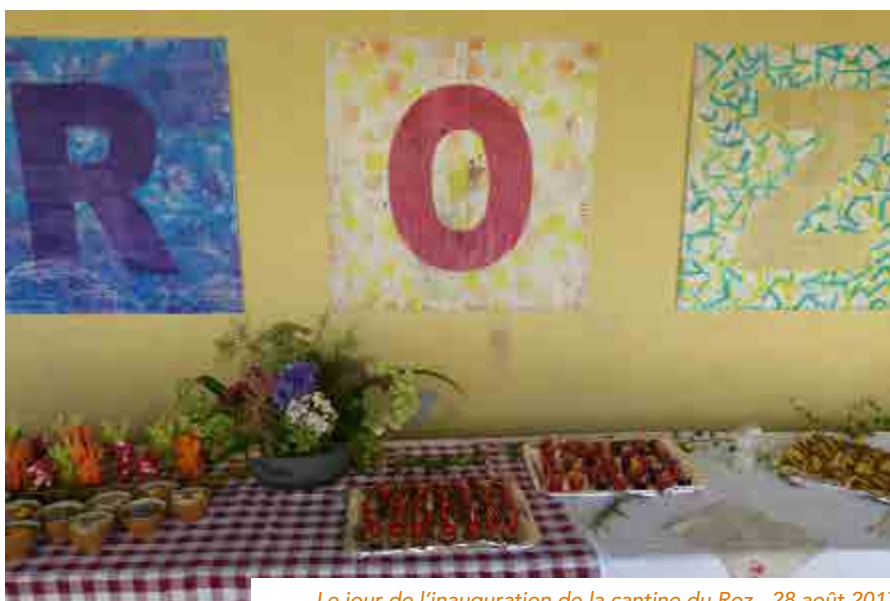
Le jour de l'inauguration de la cantine du Roz - 28 août 2017

Le réseau BRUDED a permis à la commune d'aller à la rencontre