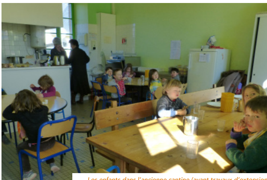
Les enfants dans l'ancienne cantine (avant travaux d'extension)

Avec le temps, des tensions entre parents et services de cuisine sont apparues et le fonctionnement « autonome » ne pouvait plus tenir. En 2012, la mairie a alors choisi de reprendre la gestion complète de la