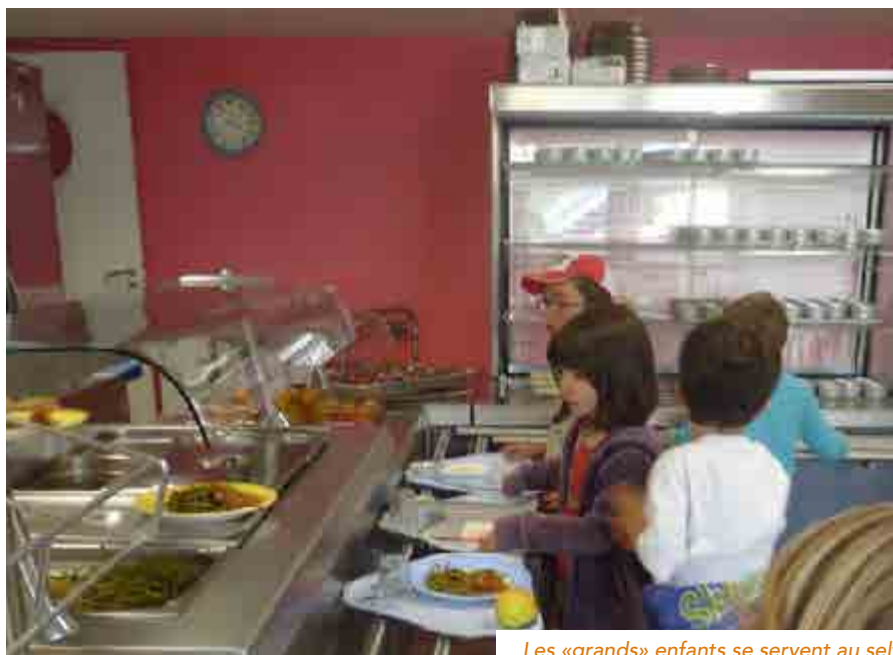
Les «grands» enfants se servent au self

La commune a reçu le 2 ème prix des trophées de la restauration territoriale de Bretagne en 2016, qui visent à mettre en lumière le savoir-faire des cuisiniers de la restauration collective. ■