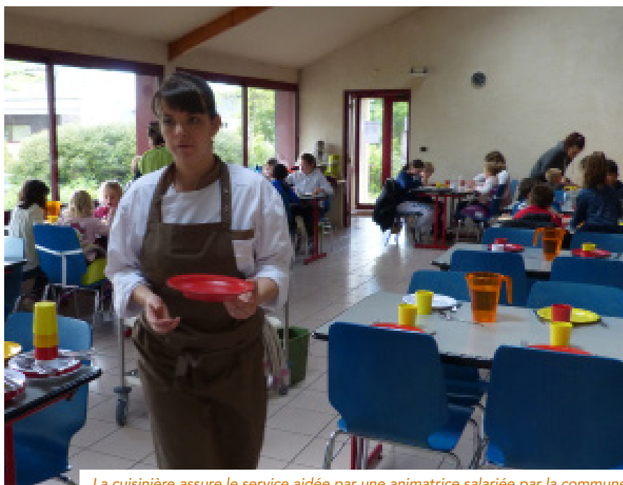
La cuisinière assure le service aidée par une animatrice salariée par la commune

Les retours des enfants et des parents sont très positifs, tant sur la qualité des plats que sur l'organisation des repas (diversité, quantité, service, autonomie, déchets...). La municipalité est également aujourd'hui très satisfaite du fonctionnement. L'une des clés de réussite du projet réside à n'en pas douter, dans la motivation de la cuisinière pour faire vivre une restauration scolaire de qualité et pédagogique pour les petits et grands. ■