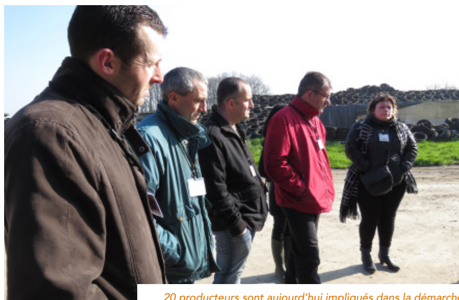
20 producteurs sont aujourd'hui impliqués dans la démarche