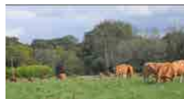
Ferme du Seillou ©

La commune a ciblé les producteurs locaux et/ou bio pour s'achalander. Ils ont de la chance d'avoir du maraichage, de la viande, du poisson (viviers Terenez), du lait sur le terroire communale ou voisin.