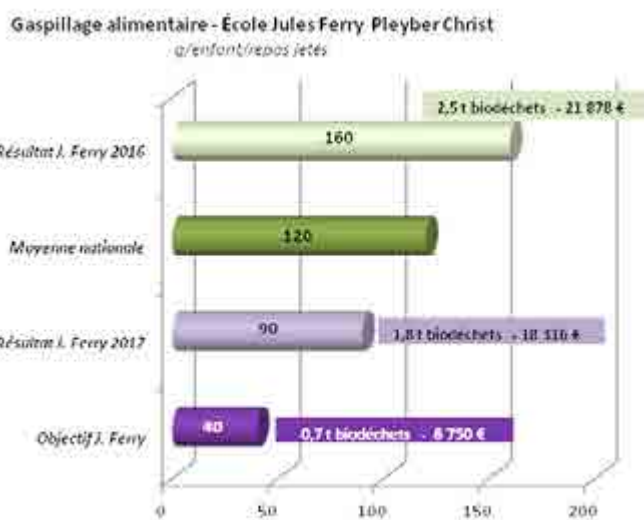
Quantité de déchets produits et objectifs à atteindre

Cette démarche entreprise par la commune a déjà fait des petits... Ainsi l'école privée Saint Pierre s'est montrée très intéressée par l'expérience, et a investi dans du mobilier adapté (12 000 € TTC) financé pour moitié par la commune. D'autres acteurs (Résidence du Brug, Genêts d'or) sont aussi intéressés par cette démarche qui, on le souhaite, profitera à tous. ■