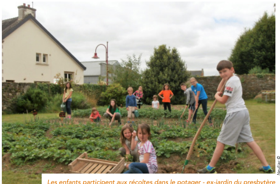
Les enfants participent aux récoltes dans le potager - ex-jardin du presbytère

Face à la diminution des effectifs des écoles à Neulliac, les élus et le cuisinier vont à la rencontre des communes voisines. Un partenariat naît en 2014, suite à des liens tissés avec une famille de Saint-Aignan qui livre des légumes pour la cantine. Afin de mettre en place le transport des repas dans de bonnes conditions sanitaires, les deux communes s'appuient sur la Direction Départementale de la Protection de la Population (DDPP). En septembre 2015, c'est chose faite, et Saint-Aignan achète un véhicule spécifique ainsi que les ustensiles