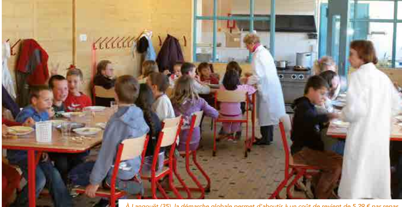
À Langouët (35), la démarche globale permet d'aboutir à un coût de revient de 5,29 € par repas.