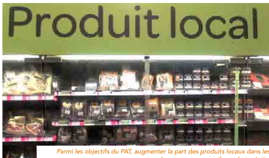
Parmi les objectifs du PAT, augmenter la part des produits locaux dans les grandes et moyennes surfaces du territoire