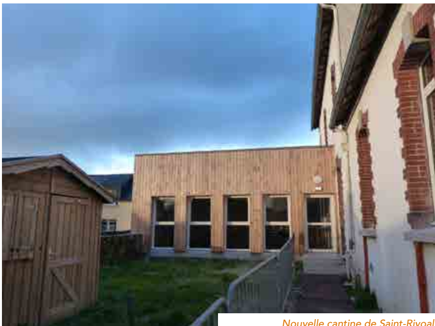
Nouvelle cantine de Saint-Rivoal

La petite commune de Saint-Rivoal avec ses projets ambitieux pour l'école et la cantine, tente d'allier au mieux les ressources locales à ses projets bien que la gageure soit difficile à atteindre. ■