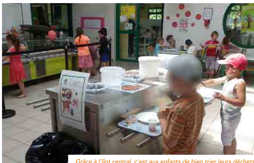
Grâce à l'îlot central, c'est aux enfants de bien trier leurs déchets

Côté recettes, les repas sont facturés 3,45€ pour les maternelles, et 3,55€ pour les primaires, le restant étant pris en charge directement par la commune. ■