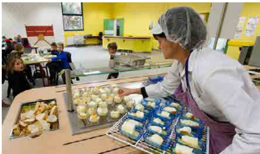
À Loperhet, les «grands» enfants se servent directement au self tandis que les plus petits sont servis directement par le personnel communal