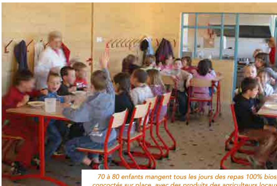
70 à 80 enfants mangent tous les jours des repas 100% bios, concoctés sur place, avec des produits des agriculteurs locaux

Dans la lignée de cette réflexion, la municipalité, dont le contrat avec l'opérateur arrive à échéance, souhaite revoir les approvisionnements de la cantine. L'idée germe alors de revenir en régie municipale et de passer directement en approvisionnements bios et locaux. « Nous avons le sentiment que faire une semaine de la bio par an, comme le font beaucoup de collectivités, représentait autant de travail que de modifier tous nos approvisionnements une fois pour toute », se rappelle le