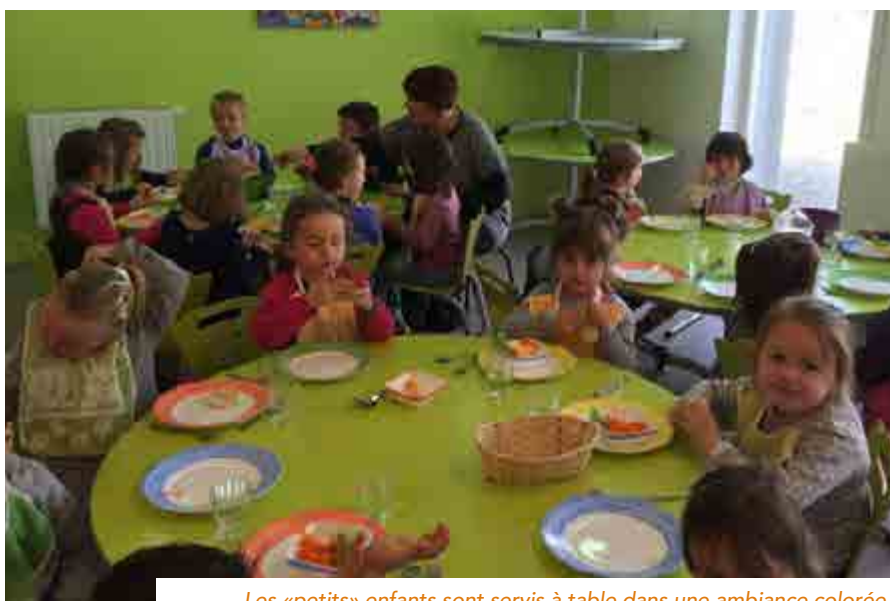
Les «petits» enfants sont servis à table dans une ambiance colorée !

Le service de la cantine était auparavant assuré dans des locaux qu'il convenait de mettre aux normes, en lien avec les préconisations de la Direction des Services Vétérinaires (DSV).