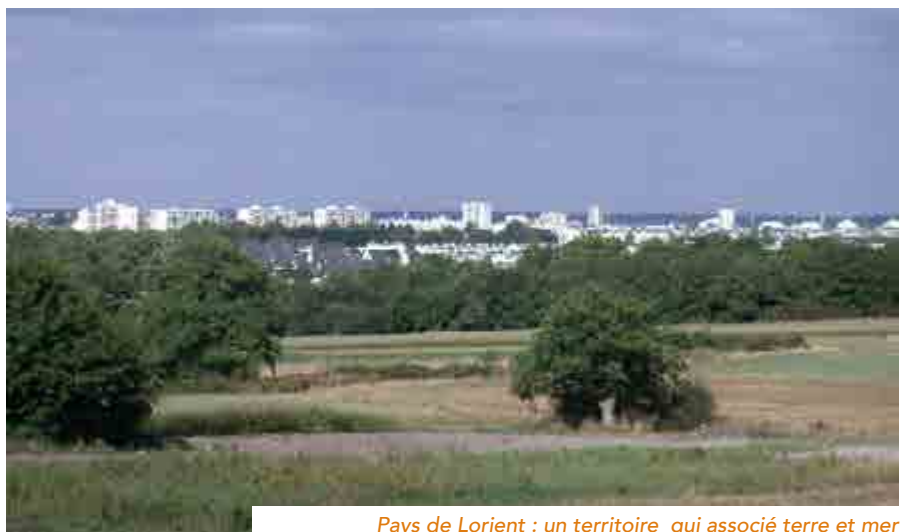
Pays de Lorient : un territoire qui associe terre et mer

de la mer et de toutes les agricultures (filères longues, courtes, bio, conventionnelle...) et les savoir-faire afin de nourrir la population, approvisionner les professionnels de l'alimentation et des industries agroalimentaires en produits agricoles locaux, ainsi que la restauration collective et la distribution.