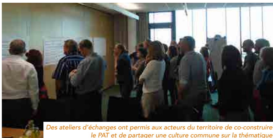
Des ateliers d'échanges ont permis aux acteurs du territoire de co-construire le PAT et de partager une culture commune sur la thématique

L'animation à l'échelle du territoire et la mise en œuvre des actions sont définies début 2018. ■