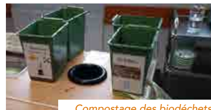
Compostage des biodéchets

Le gaspillage moyen a été réduit à 90 grammes par repas, soit une diminution de 44% par rapport aux premières pesées ! Constat intéressant : la tendance est inversée. Le gaspillage provient principalement