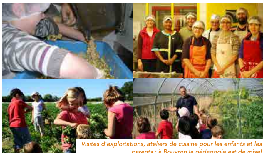
Visites d'exploitations, ateliers de cuisine pour les enfants et les parents ; à Bouvron la pédagogie est de mise!