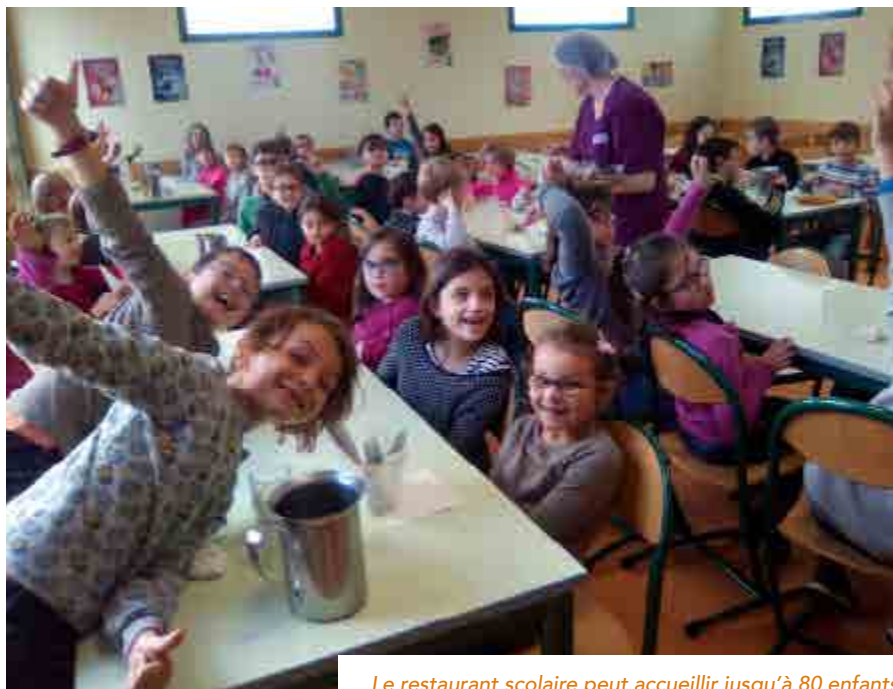
Le restaurant scolaire peut accueillir jusqu'à 80 enfants

Un comité de pilotage a été constitué pour assurer un suivi régulier du fonctionnement de la cantine. Il comprend le maire et une adjointe, la cuisinière, les familles, le personnel pour le service en salle et Agores (Association nationale de la restauration territoriale). Ce suivi doit permettre à la commune d'affiner ce nouveau fonctionnement avec le temps et les usages. ■