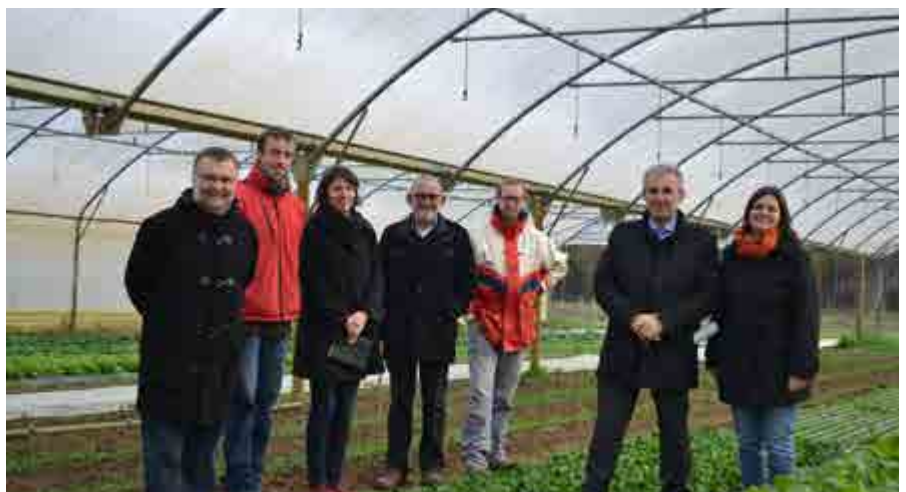
La démarche de PAT s'inscrit dans la continuité du soutien de Redon Agglomération à l'agriculture notamment avec la réalisation d'un Espace Test Agricole sur la ferme de Cranhouët à Théhillac (56)

10 ans par les acteurs du territoire, et l'implication de la collectivité sur les questions liées à l'agriculture et aux circuits courts ont posé les bases d'une politique de territoire en matière d'alimentation.