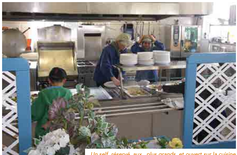
Un self réservé aux plus grands et ouvert sur la cuisine