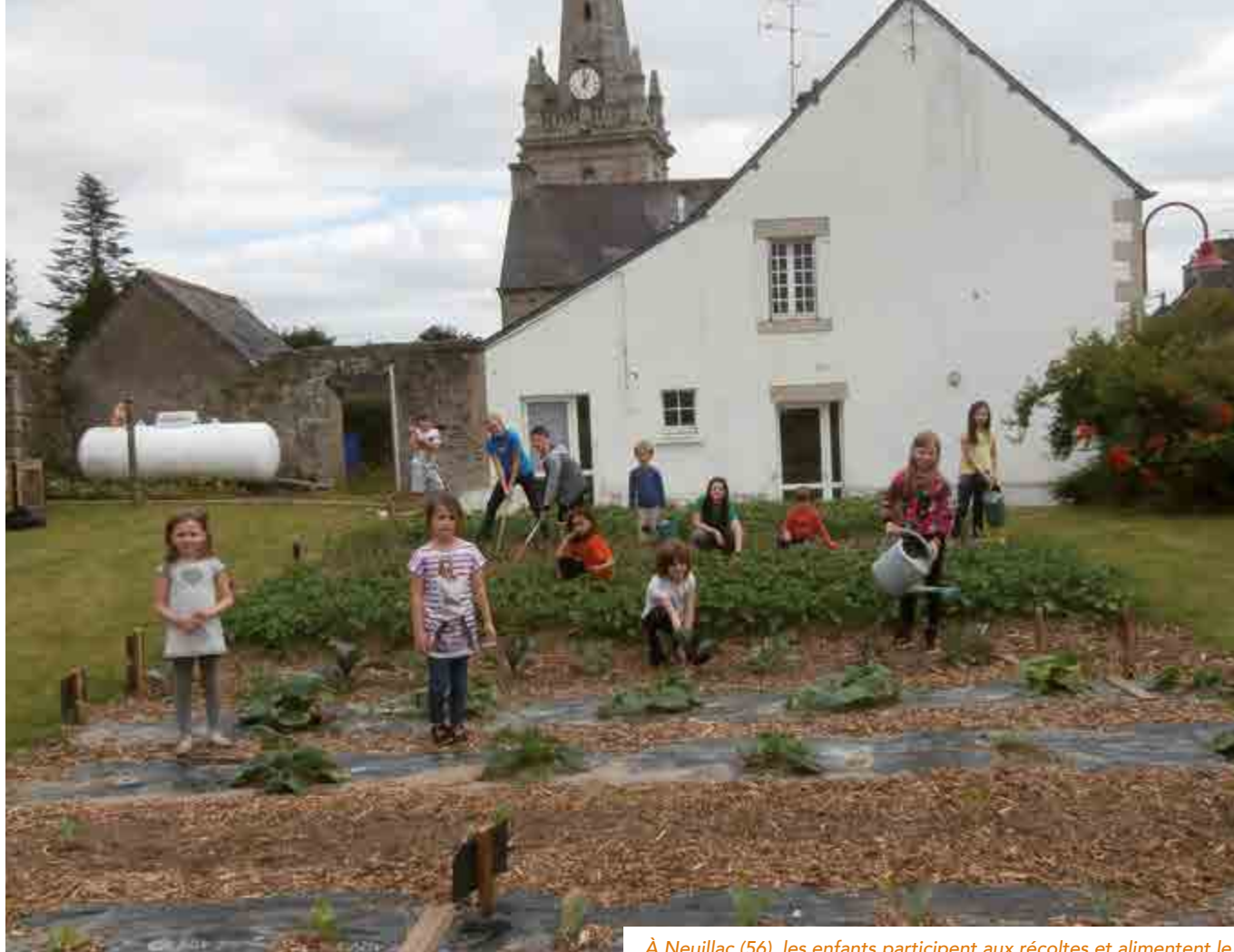
À Neuillac (56), les enfants participent aux récoltes et alimentent le compost du potager communal qui approvisionne la cantine.