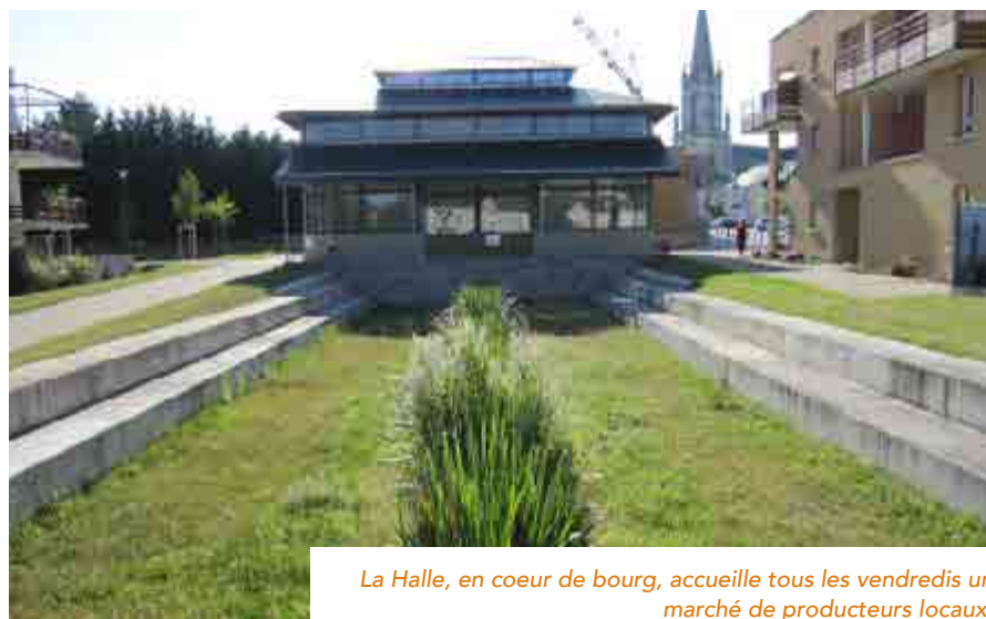
La Halle, en coeur de bourg, accueille tous les vendredis un marché de producteurs locaux.

Ce sont les enfants qui trient leurs déchets, « avec une pesée du retour de l'assiette pour mesurer le gaspillage, de l'ordre de 35 à 50 kilos par semaine ». Les pluches sont emmenées deux fois par semaine sur le bassin de rétention des services techniques où a été installé un poulailler avec des poules et des oies. Pour poursuivre la démarche, « nous souhaitons développer le lien entre les agriculteurs et les enfants soit à la cantine soit sur les exploitations » conclut le maire. ■