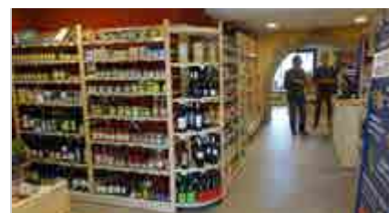
Épicerie bio à Nostang

C'est le volet restauration collective du PAT qui a été présenté et retenu dans l'appel à projets 2016-