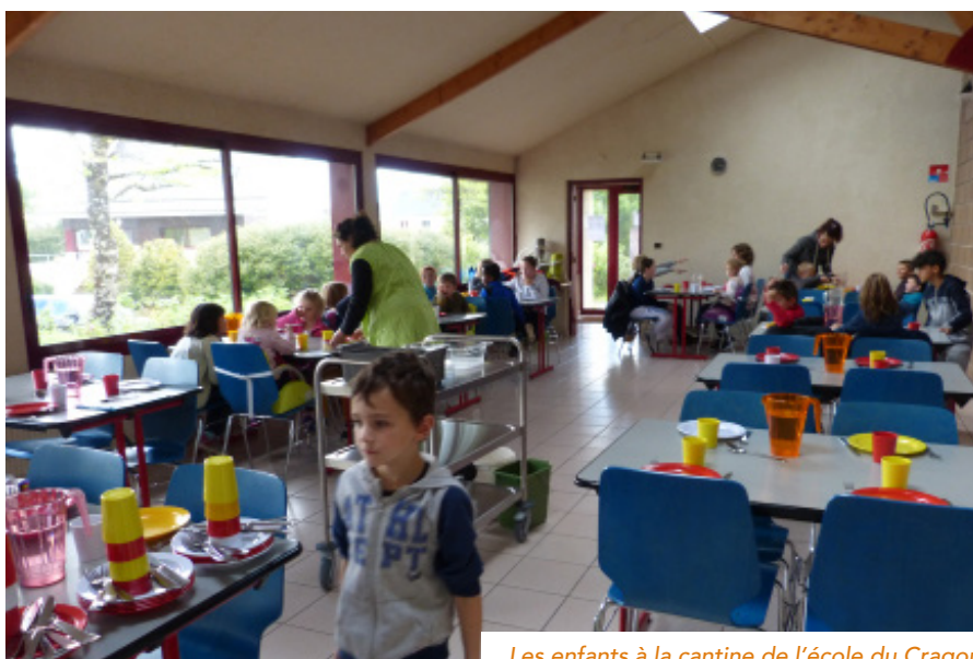
Les enfants à la cantine de l'école du Cragou

Lors d'une visite à Gourlizon (29), commune adhérente à BRUDED, les élus du Cloître découvrent un autre mode de fonctionnement avec la possibilité de recourir à une entreprise privée pour la gestion de la cantine. La simplicité du fonctionnement séduit les élus : la société privée met à disposition de la commune une cuisinière, et la provenance des aliments est encadrée par le contrat qui relie la commune au prestataire.